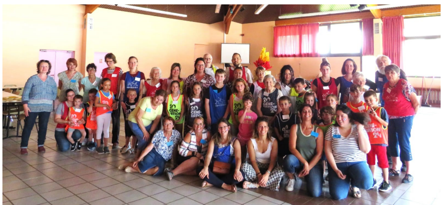
Une quarantaine de petits et grands étaient réunis pour une après midi festive