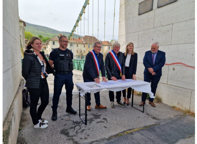
Signature de l'acte au milieu du vieux pont

Un agent a été recruté. Cependant suite à l'obtention de son concours, 8 mois de formation de brigadier sont nécessaires. Un second agent prendra ses fonctions au mois d'octobre.